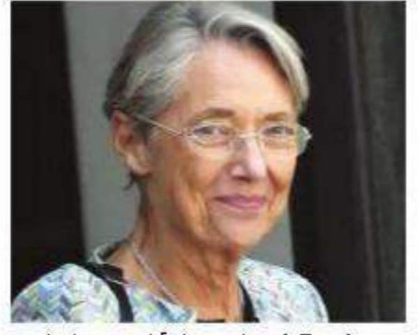
నియామకాన్ని ధృవీకరించారు. ఫ్రాన్స్ ప్రధానిగా ఎడిట్ క్లెన్ 1991 మే నుండి 1992 ఏప్రిల్ వరకు అప్పటి ఆర్యక్షుడు ఫ్రాన్కోయిస్ మిస్ట్రాలాడ్ హయాంలో పనిచేశారు. బార్నోల్ కేలకెన్

పారిస్ : గత మూడు దశాబ్దాల్లో మొదటిసారిగా ఒక మహిళను ఫ్రాన్స్ ప్రధానిగా నియమించారు. కార్మిక శాఖ మంత్రిగా పనిచేసిన బార్బెస్ ఫ్రాన్స్ ప్రధానిగా నియమిస్తున్నట్లు ఆర్యక్షుడు ఎమ్మార్ఎంలతో మాట్లాడు ప్రకటించారు. దేశంలో పెద్ద ఎత్తున కాసులు అమలు చేయడం తెలిసిన సంస్కృత ప్రజావేదిక అను సేవకుల వహిస్తారని తెలిపారు. అంతకుముందు ప్రాన్స్ జేన్ కార్బెన్స్ ఆర్యక్షుడికి తన రాజీనామాను అందజేశారు. పట్టిలో మాట్లాడు ఆర్యక్షుడుగా ఎన్నికైన సేవకులలో కార్మిక ప్రయోజనాల పూర్తిగా మార్పు చేయడం చేస్తూ పెద్ద ఎత్తున సేవకులకు ప్రయోజనాల అందించారు. అందులో భాగంగానే ఈ చర్యలు చేపెట్టారు. చాలా తరణి వరుసలలో సేవకులకు ఎటెబెజ్ బార్బెస్